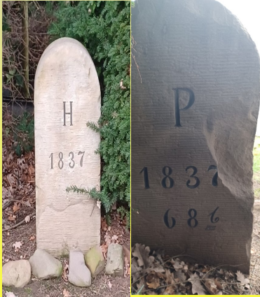
So kann ein historischer Grenzstein der Strecke Hannover – Preußen aussehen

Es gab einige von diesen Grenzsteinen auf Schlüsselburger Boden. Da sich aber niemand für diese Steine interessierte, kamen Interessenten aus der näheren und fernerer Umgebung und nahmen sich diese Steine. Im Zuge mehrerer Baumaßnahmen verschwanden in